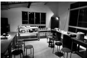
2015.1.9 モバイルキッチンでできること #2