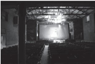
伊藤丈紘 [Out there]より