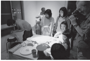
2014.10 blanClass 5周年記念イベント&パーティー [モバイルキッチンでできること]

3.13 [金] nano school #26 | [そこにそれはない、あるのかもしれないけれど] start 18:30 ¥1,200 / 学生 ¥1,000 (要予約)