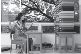
Miss Universe [SSSSLLLOOOWWW Network]